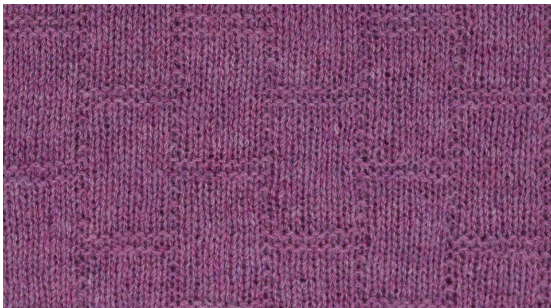
Detalj av mønsteret.