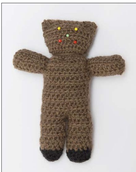
Plasser nåler til øyne, snute og munn.