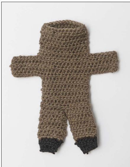
Legg delene rette mot rette og sy sammen i kanten. Vreng bamsen.