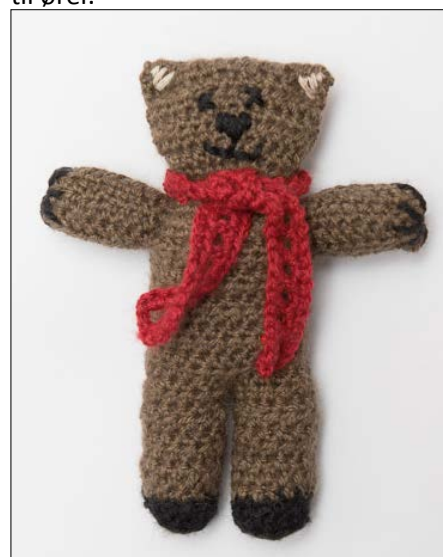
Broder øyne, snute, munn og inni ørene. Broder lange sting på hver hånd til klør.