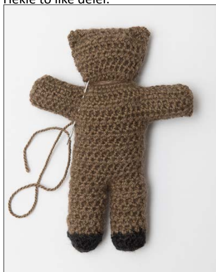
Surr en tråd rundt halsen, knyt stramt til. Sy tråklesting langs overgangen mellom armer og kropp, trekk tråden stramt og fest den godt.