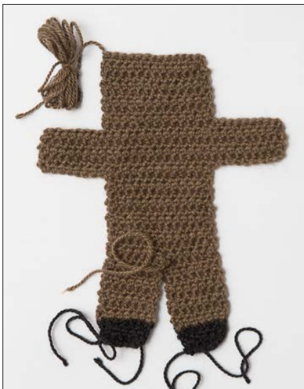
La delene ha litt lang oppleggs-tråd, disse brukes til montering. Hekle to like deler.

3. rad: 1 lm, * 2 fm om lm, hopp over 1 hst *, gjenta fra *-* ut raden, klipp av tråden. Fest alle løse tråder godt.