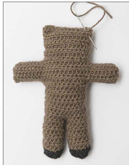
Fyll bamsen og sy igjen øverst på hodet. Samtidig sys noen skrå sting til ører.